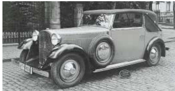
Unvergessen: Der Adler Standard 8 aus dem Jahre 1932 nach einem Entwurf von Walter Gropius im Dezember 1931

1932 wird der Adler Primus vorgestellt, dessen Cabrio-Version bei Karmann hergestellt wird. Als Meisterleistung jener Jahre werden Konstruktion und Ausführung des absolut wasserdichten Klappverdecks gefeiert; sogar zarte Frauenhände können es ohne Probleme öffnen und schließen. Der Primus verfügt über eine hydraulische, auf alle vier Räder wirkende Fußbremse und ein nicht synchronisiertes Viergang-Getriebe, das nach aufmerksamem Zwischengas verlangt.